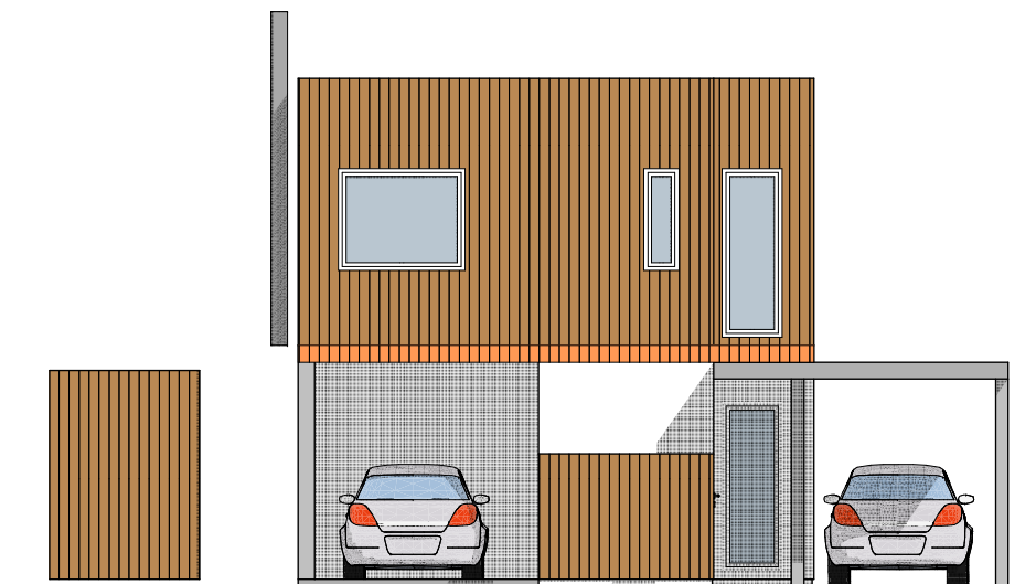
1:100 Fasade øst